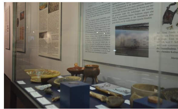
4_ Archäologische Funde in der Ausstellung