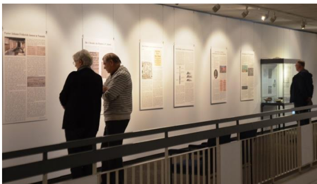
3_Blick in die Ausstellung „300 Jahre Weihnachtsflut“, Foto: Landesmuseum Natur und Mensch Oldenburg