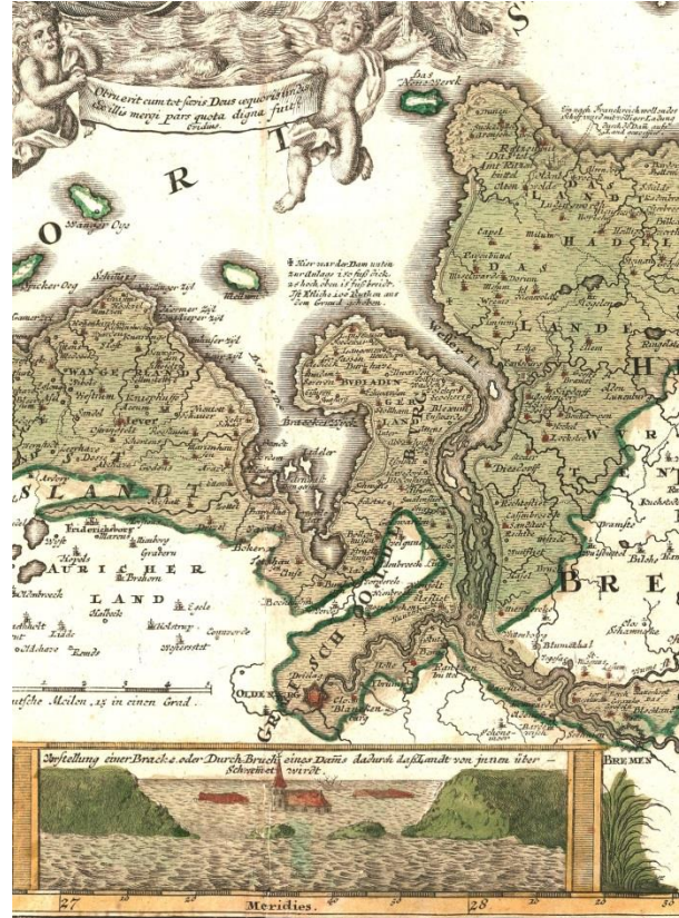
6_ Historische Karte in der Ausstellung

Die genehmigungs- und vergütungsfreie Nutzung der Bilder ist nur im Rahmen aktueller Berichterstattung zulässig und bei jeder Nutzung ist der Urheber anzugeben.